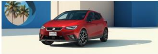
MARCA: SEAT MODELO: IBIZA AÑO: 2025